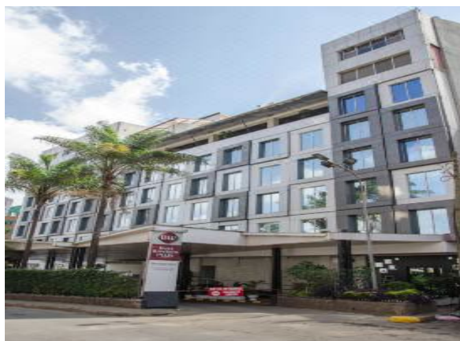
Movenpick 4 Stars