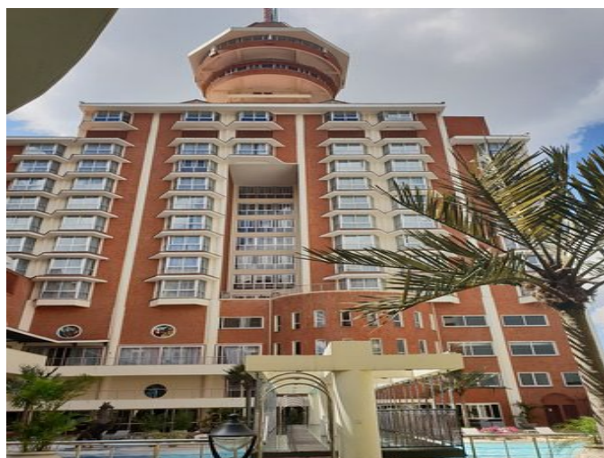
Hotel reservation deadline : 04/07/2022

All participants to be accredited should stay at the official hotel. Reservations at the official hotels